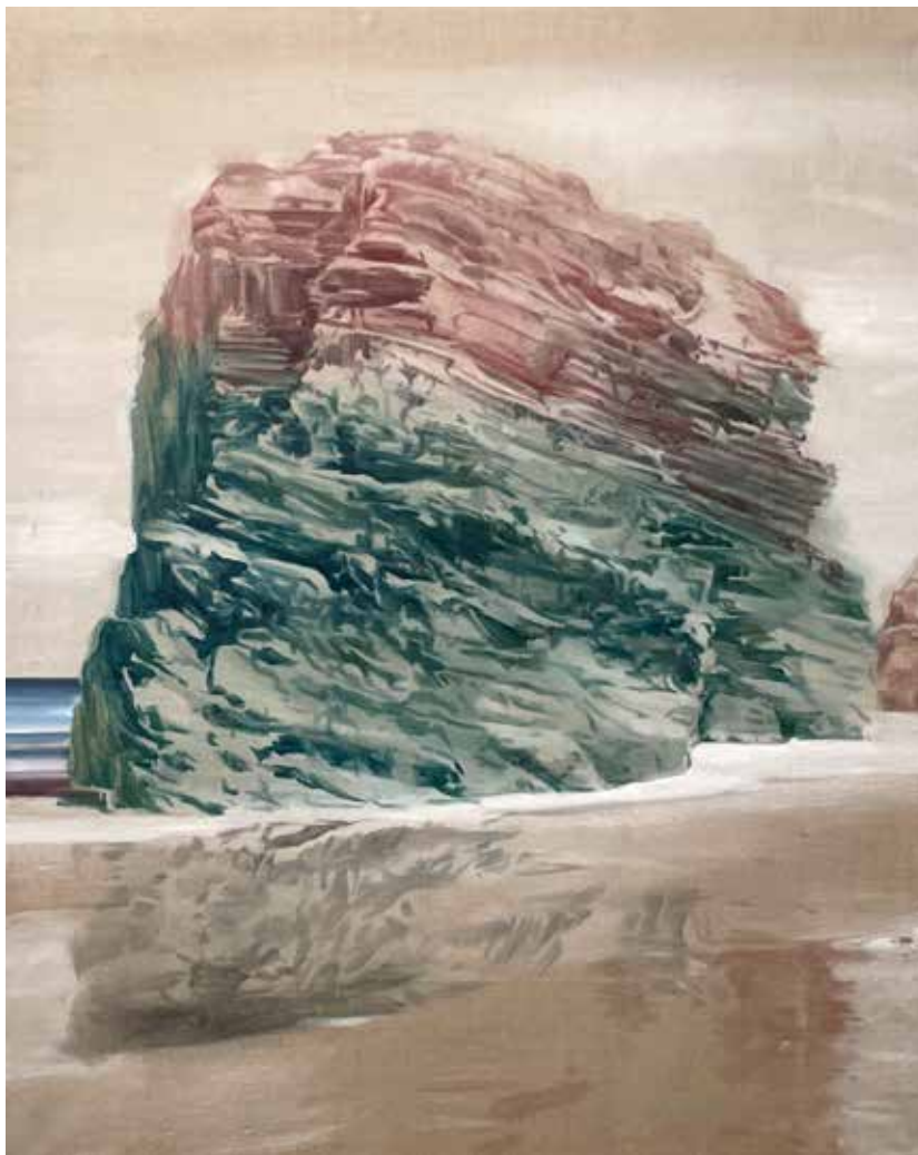
Granate Óleo sobre lino 162 x 130 cm 2022