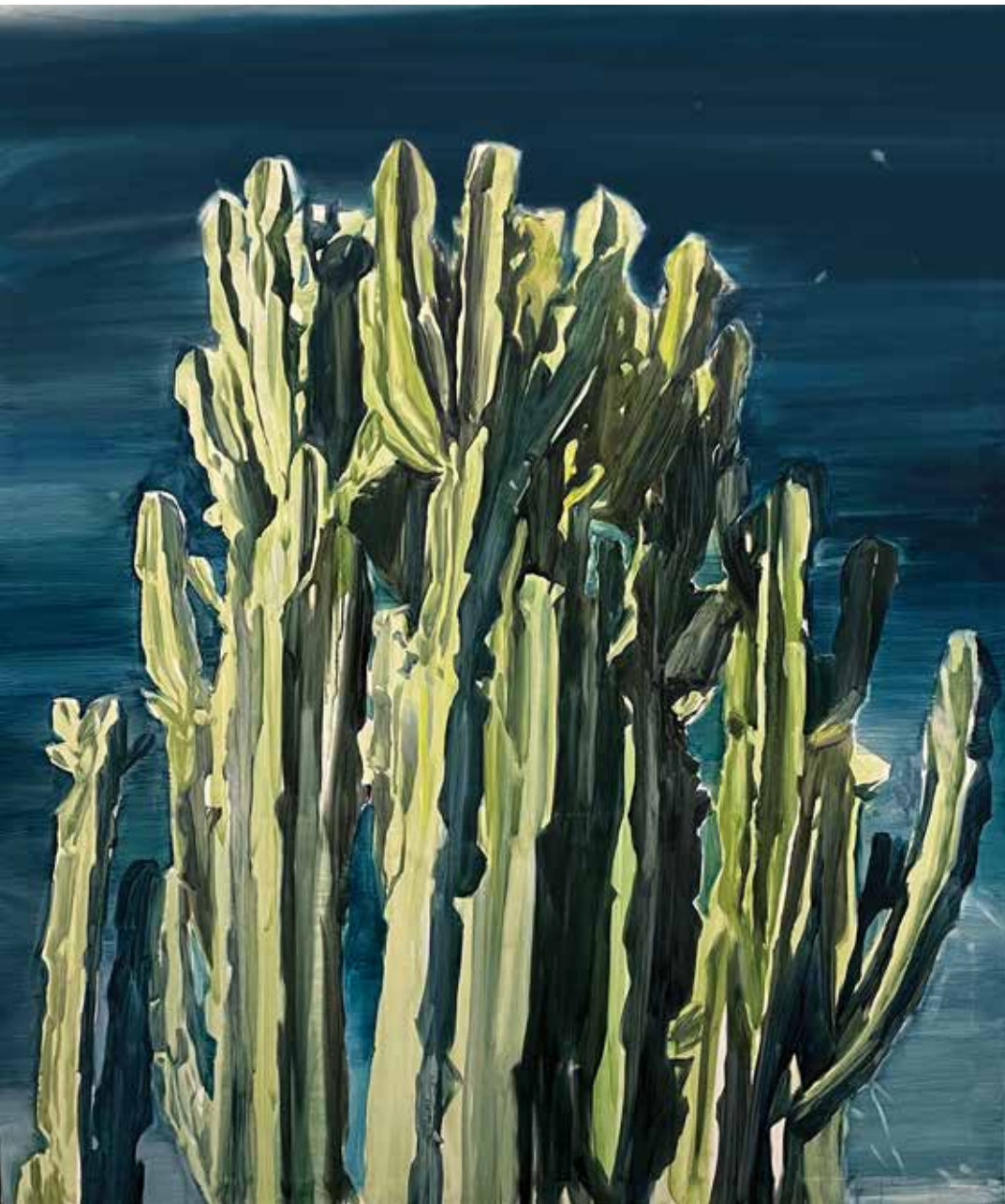
Ámbar Óleo sobre lino 162 x 130 cm 2021