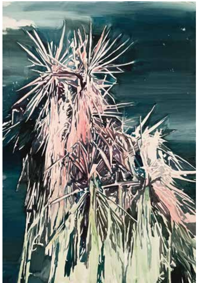
Amatista Óleo sobre lino 150 x 100 cm 2021