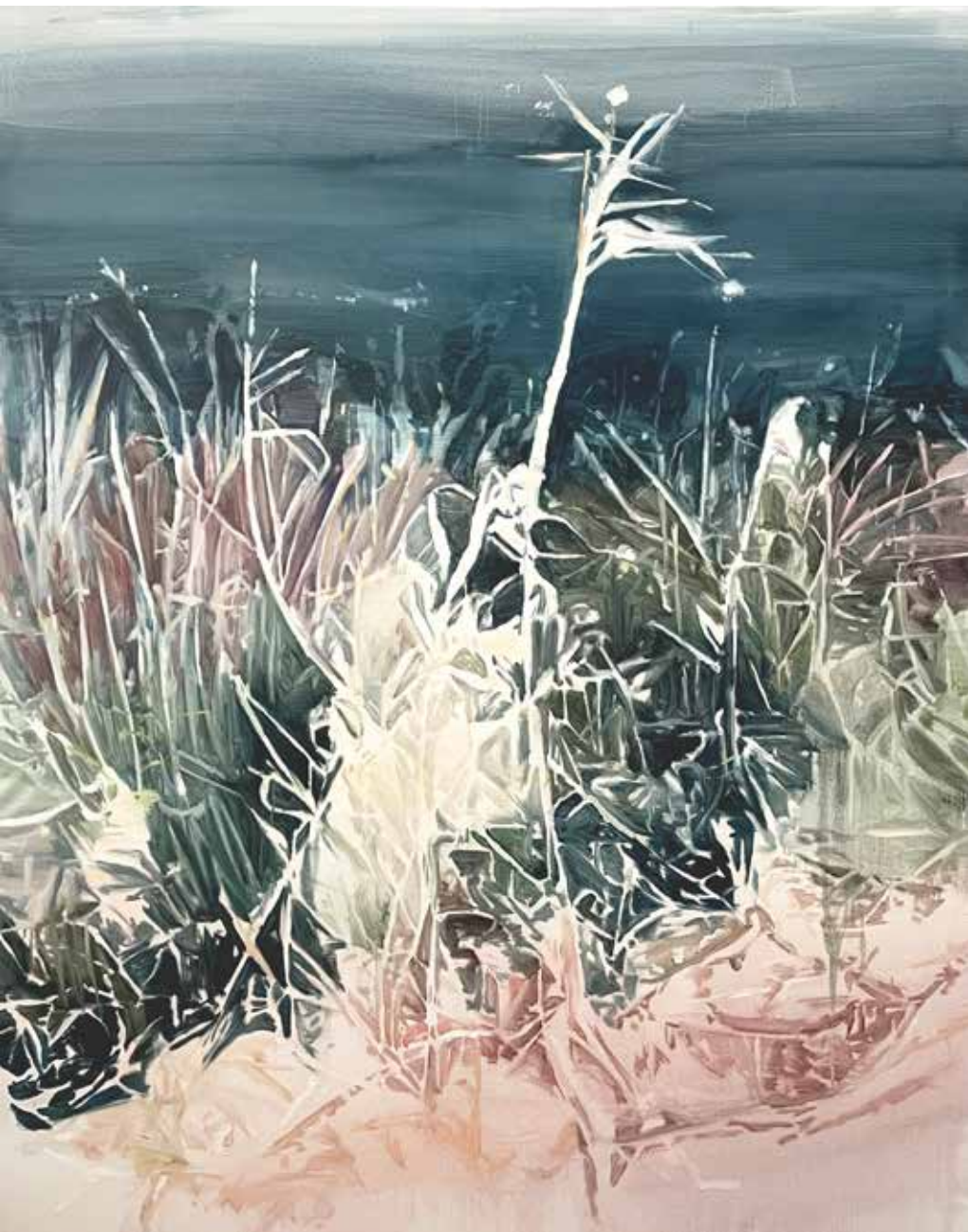
Ancestral II Óleo sobre lino 162 x 130 cm 2022