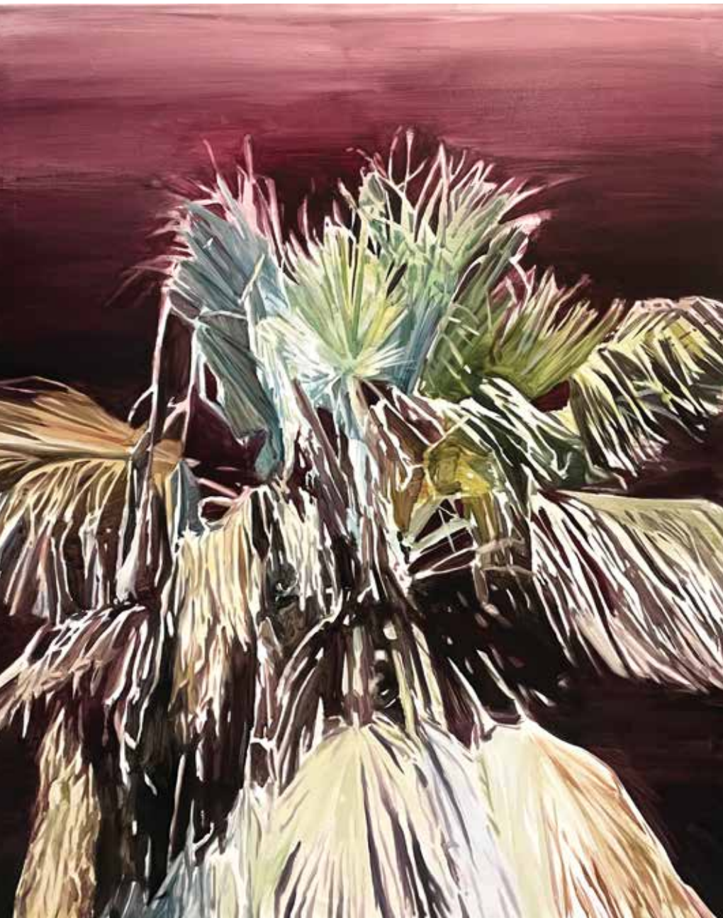
Turmalina Óleo sobre lino 162 x 130 cm 2021