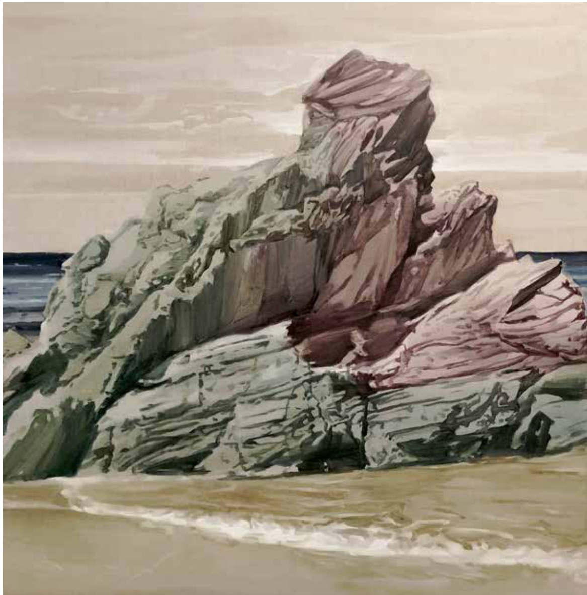
Arenisca Óleo sobre lino 150 x 150 cm 2021