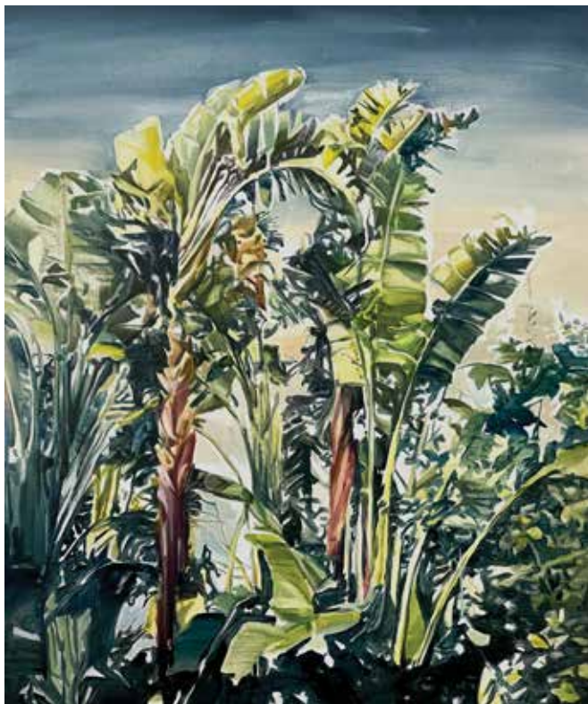
Plata Óleo sobre lino 100 x 81 cm 2022