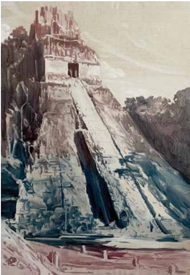
Tikal Óleo sobre lino 150 x 100 cm 2022